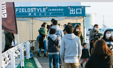
出入口サーモカメラ(検温)・入退場管理