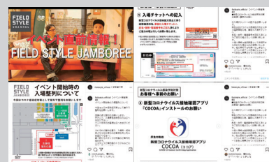
SNSを使用した事前の注意喚起など

チケット完全前売制、入口での検温と入退場管理、マスクの着用義務、手指消毒やソーシャルディスタンス協力をお願い、動線拡幅、場内換気、また、混雑状況や事前注意喚起の配信などを行い、来場の皆様にご理解とご協力頂き、安全に運営・閉幕することができました。