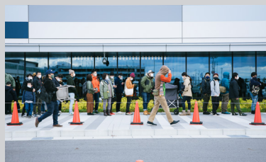
ソーシャルディスタンス